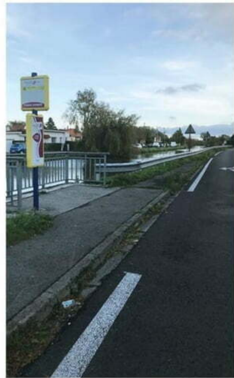
L'accumulation d'eau face à l'arrêt de bus du pont de la Planche - Tournoire a été résolue.

De même, dès la première quinzaine d'octobre, les fossés bordant les voiries communales vont être entretenus. Là encore, il faut le rappeler, c'est aux propriétaires riverains d'entretenir les fossés qui bordent ou traversent leurs terrains.