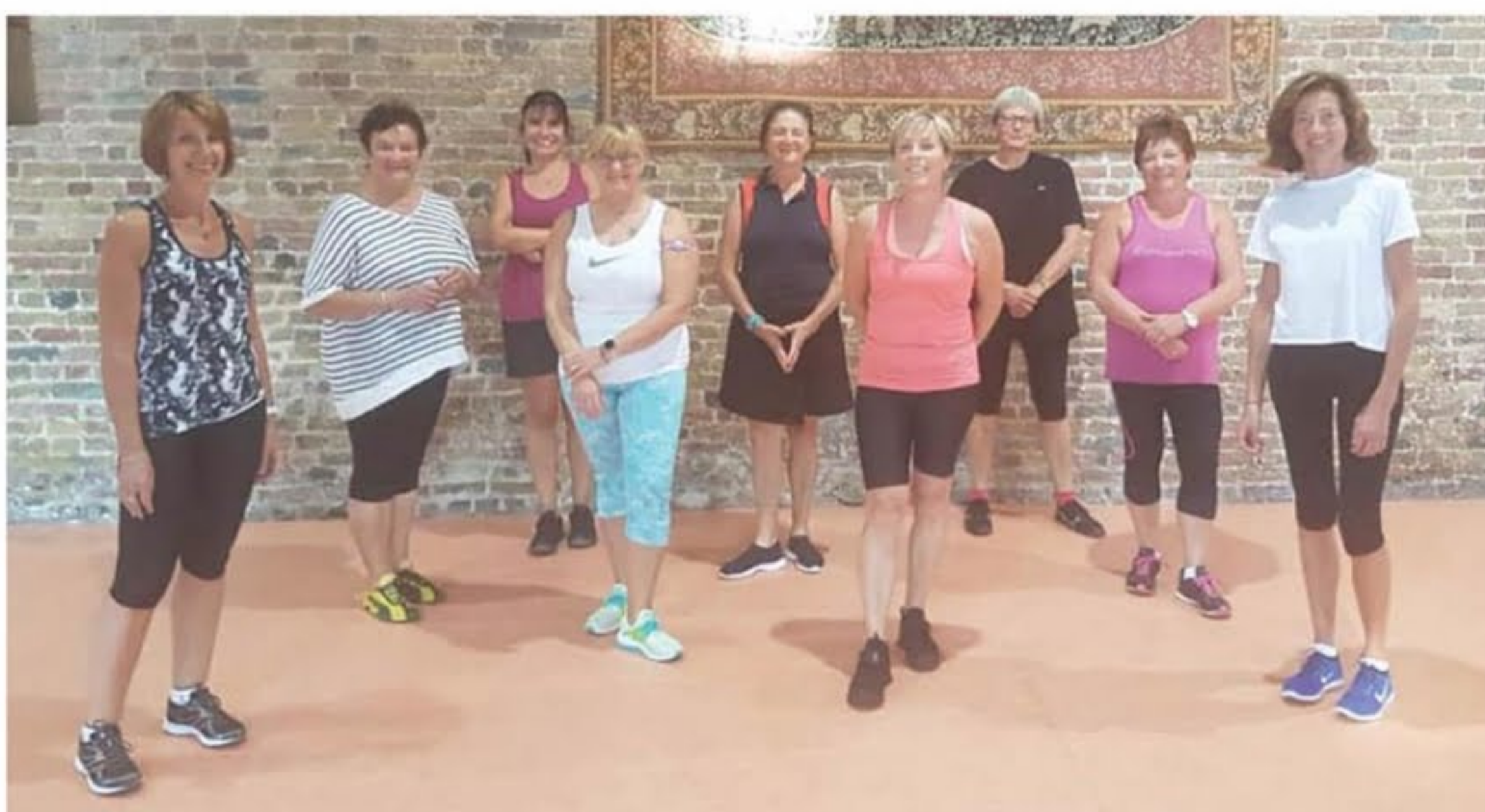
Tous les mardis, l'association Les Pétilantes propose du coaching convivial à base de mouvements de gymnastique accessibles à tous.

Ecrivez nous à l'adresse : mairie.hames-boucres@orange.fr ou contactez la Mairie au 03.21.35.20.53.