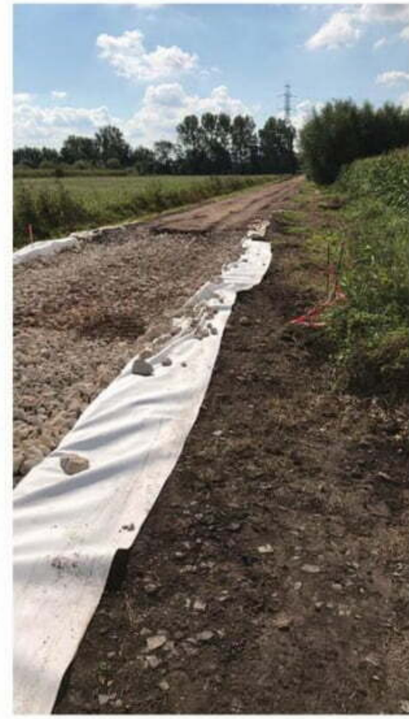
Remise en état du chemin Plouvin

La commune va ainsi engager un diagnostic complet des trottoirs et caniveaux, avant d'en assurer le nettoyage global. A l'issue de ce nettoyage, comme le prévoit la loi, il reviendra aux locataires et propriétaires d'immeubles l'entretien des fils d'eau.